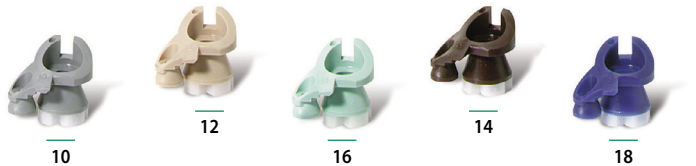
Falcon® 6504 Rain Curtain™-Düsen

Niederschlagsraten basierend auf Halbkreisbetrieb.